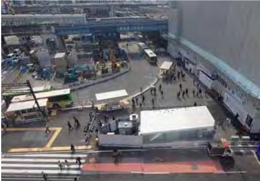
①東口バスロータリー全景(北側 H25.10中旬)