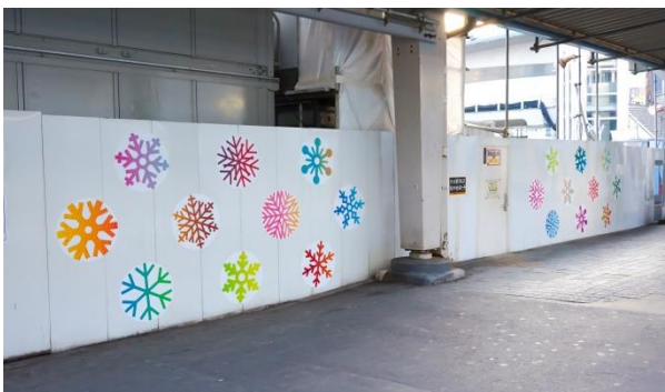
渋谷駅街区土地区画整理事業工事現場の仮囲い