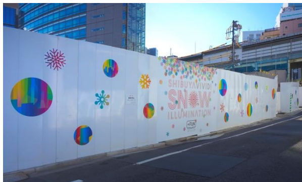
渋谷駅南街区工事現場の仮囲い