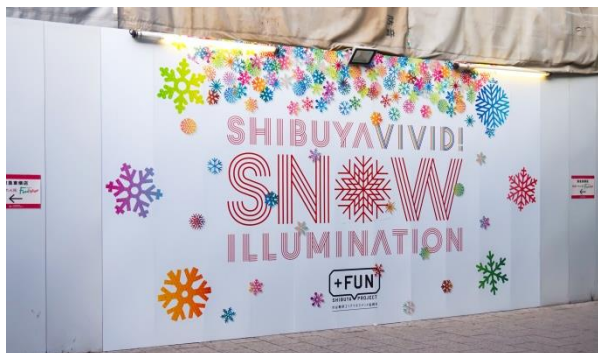
渋谷駅街区土地区画整理事業工事現場の仮囲い