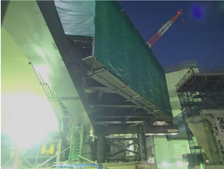
⑧歩行者デッキ架設工事 上屋施工状況(ヒカリエ側)