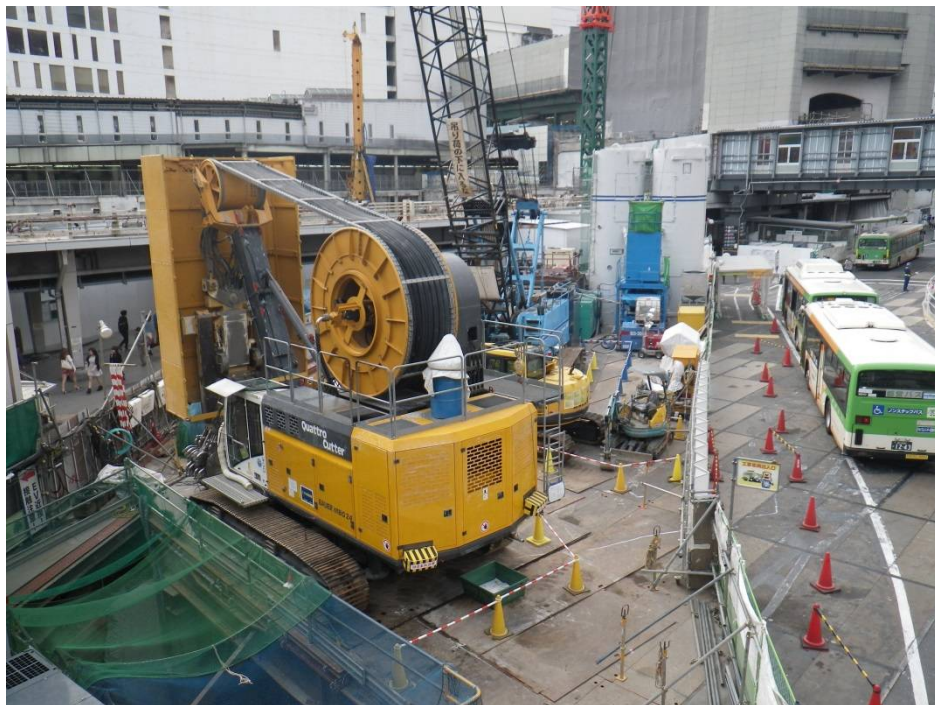
① 渋谷川 現況(H26.10月上旬)