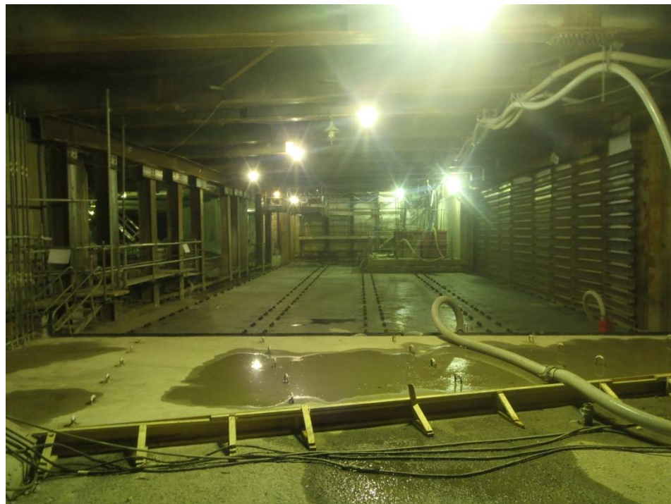
仮受け鉄板架設完了