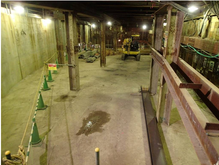
③東口地下広場 躯体構築状況(B2F)