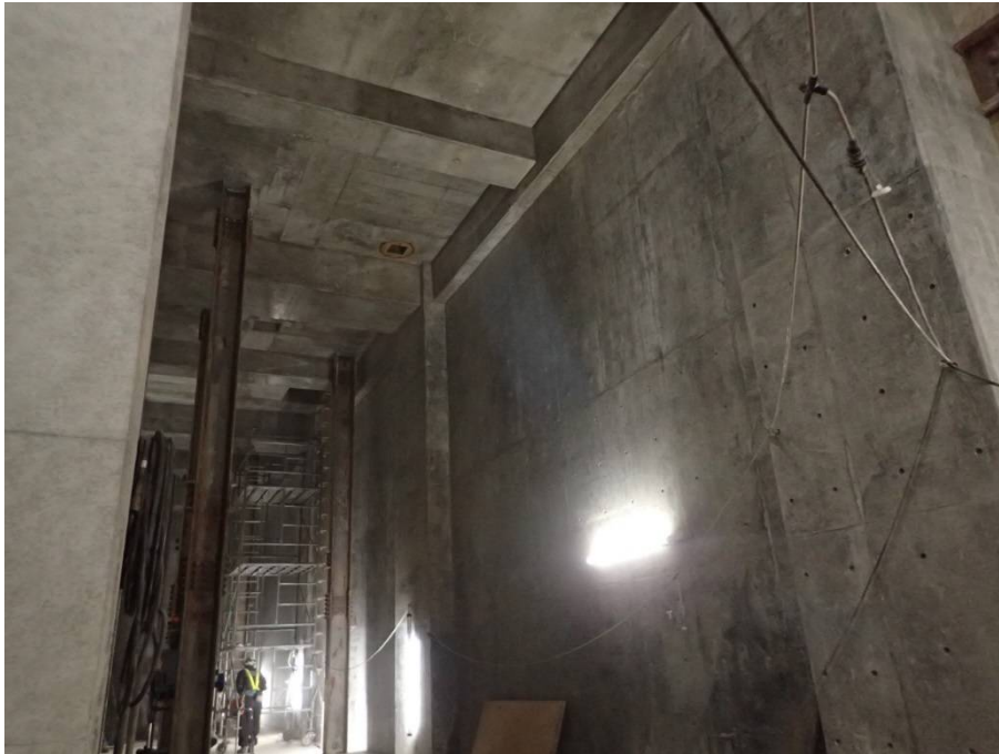
①地下貯留槽 躯体構築状況(B4F)